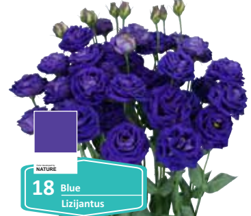
18 Blue Lizijantus