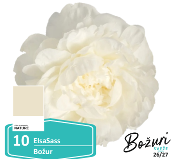
NATURE 10 ElsaSass Božur