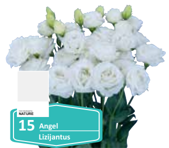
15 Angel Lizijantus