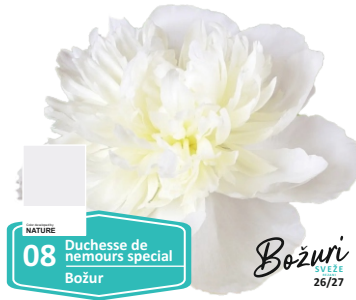
NATURE 08 Duchesse de nemours special Božur