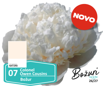
NATURE 07 Colonel Owen Cousins Božur