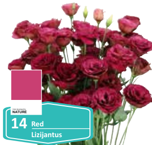
14 Red Lizijantus