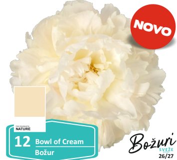
NATURE 12 Bowl of Cream Božur