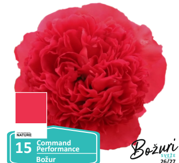
NATURE 15 Command Performance Božur