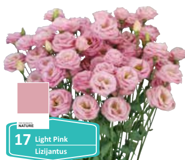
17 Light Pink Lizijantus