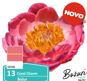
NATURE 13 Coral Charm Božur