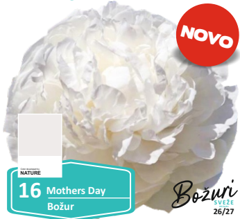
NATURE 16 Mothers Day Božur