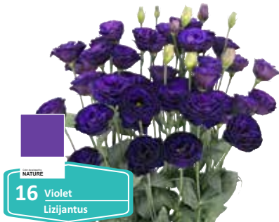
16 Violet Lizijantus