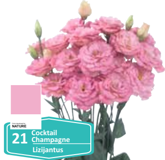
21 Cocktail Champagne Lizijantus