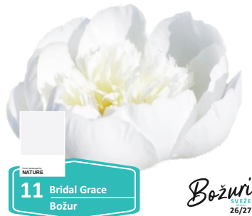
NATURE 11 Bridal Grace Božur