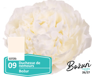
NATURE 09 Duchesse de nemours Božur