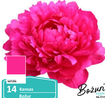
NATURE 14 Kansas Božur