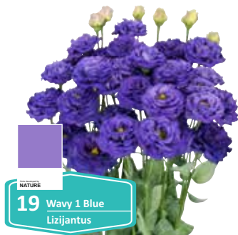
19 Wavy 1 Blue Lizijantus