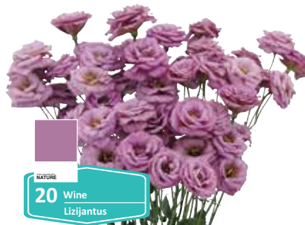
20 Wine Lizijantus