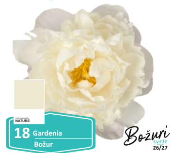
NATURE 18 Gardenia Božur